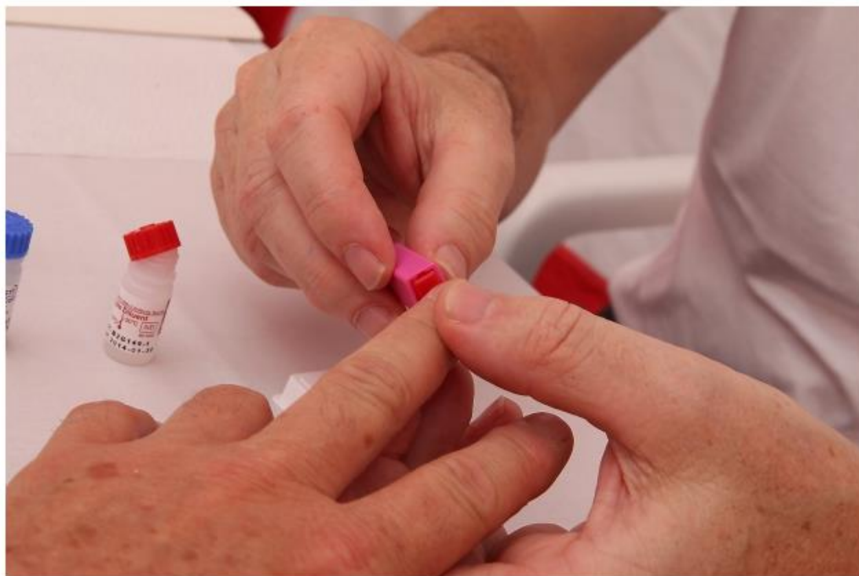
Le trod, un nouveau mode test de dépistage du sida

Il existe désormais un nouveau mode de dépistage du sida. Une simple piqûre au bout d'un doigt et le résultat s'affiche en quelques minutes. Ça s'appelle le Trod, le test rapide d'orientation et de diagnostic. Dans le Nord-Pas-de-Calais, trois associations sont habilitées à pratiquer ce test, notamment l'ADIS.