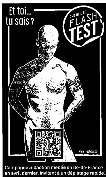
Campagne Sidaction menée en Ile-de-France en avril dernier, invitant à un dépistage rapide.