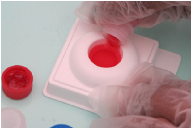
Étape 3 du TROD : l'ajout de trois révélateurs qui au final donnent une coloration bleue