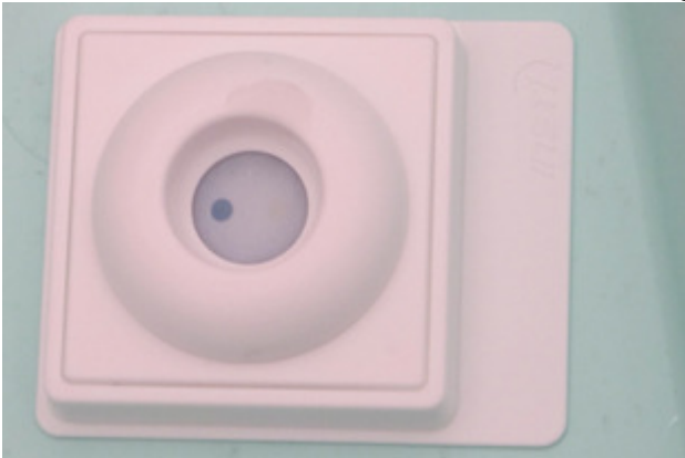
Étape 4 du TROD : la lecture du résultat se fait 1 mn à peine après la piqûre. Un seul point bleu, ça va !

Une grande tente blanche dressée devant la Poste dans le carré piéton, rue Maréchal Leclerc à Saint-Denis, c'est là qu'opèrent depuis quelques années les membres de l'association RIVE. À la veille de la journée mondiale du VIH/sida, c'est l'occasion pour eux de proposer aux passants un dépistage gratuit et anonyme d'une éventuelle infection sexuellement transmissible (IST).